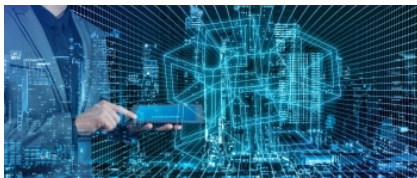
De aquí al año 2030, Bruselas quiere que el 100% de las zonas pobladas estén cubiertas por el 5G.

Bruselas (15/09/23).- La Unión Europea se ha propuesto que esta década marque un antes y un después en el desarrollo digital del bloque. Este impulso, al que se ha bautizado como Década Digital, llega con varios hitos que cumplir, entre ellos el avanzar en una Europa digital sostenible y competitiva.