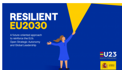
Presidencia española del Consejo Informe Resilient EU2030

Bruselas (15/09/23).- El presidente del Gobierno en funciones, Pedro Sánchez, ha comparecido este viernes, 15 de septiembre, en un acto de la CEOE en el que ha expuesto el informe que la Presidencia española presentará el próximo 6 de octubre en la cumbre de Granada. Una propuesta que cuenta con 9 ejes de acciones para fortalecer la autonomía estratégica abierta y reforzar el liderazgo global de la Unión Europea.