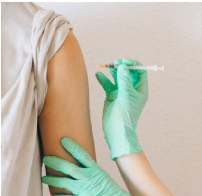
La vacuna ha sido desarrollada por Moderna

Bruselas (15/09/23).- La Comisión Europea ha autorizado la vacuna contra la COVID-19 adaptada a Spikevax XBB.5.19, desarrollada por Moderna. Según la Comisión, este es otro paso importante en la lucha contra la enfermedad. Es la tercera adaptación de esta vacuna para responder a nuevas variantes de COVID.