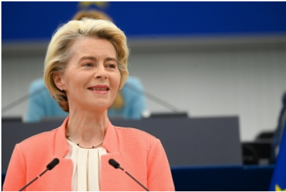
Comisión Europea Ursula von der Leyen

Bruselas (15/09/23).- Quedan pocos meses para las próximas elecciones europeas pero la actual presidenta de la Comisión Europea aún no ha anunciado si busca una reelección.