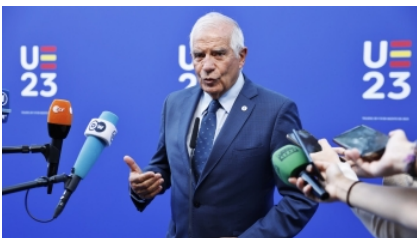
Comisión Europea Josep Borrell

Bruselas (15/09/23).- Este martes el Consejo de Asuntos Generales será el escenario de un primer debate sobre si las lenguas deben pasar a ser oficiales en todo el bloque.