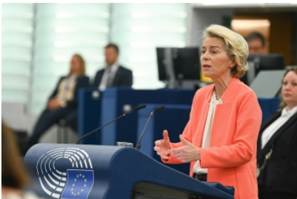
Comisión Europea Von der Leyen

Bruselas (15/09/23).- Como cada septiembre todas las miradas se han puesto esta semana en el discurso anual de la presidenta de la Comisión Europea.